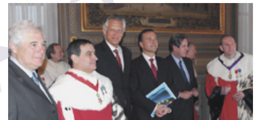
De izquierda a derecha: Sr. Pascal Clément, Sr. Jean-Louis Nadal, Sr. Dominique de Villepin, Sr. Franco Frattini, Sr. Jean-Louis Debré, Sr. Guy Canivet.

son indispensables para construir una base de confianza y crear una cultura judicial común.